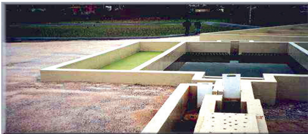
Figura 2. Ilustración de la infraestructura de la planta de tratamiento.

el criterio mínimo de salubridad. A la izquierda de la Figura 2, se observa el bebedero de animales y en el medio el tanque de tratamiento químico del agua con hipoclorito de sodio, para la obtención de agua potable, a la cabeza del tanque se observa el grifo.